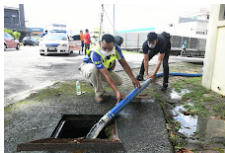
MBPJ KOMITED TANGANI BANJIR (1).jpg 102K