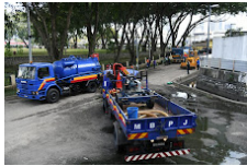
MBPJ KOMITED TANGANI BANJIR (3).jpg 110K