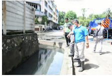
MBPJ KOMITED TANGANI BANJIR (4) - DATUK BANDAR TURUN PANDANG MELIHAT KAWASAN HOTSPOT BANJIR DI Lorong 51A.jpg 83K