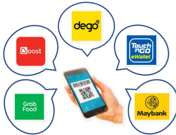
Rajah 2: Rakan Strategik

Seperti yang kita sedia maklum, pandemik covid-19 merupakan satu detik sukar dan mencabar kepada negara yang pastinya telah merubah landskap sosioekonomi Negara. Justeru itu, dengan menjalankan peniagaan transaksi tanpa tunai secara tidak langsung dapat mengurangkan risiko jangkitan dan penularan Covid-19 di kalangan peniaga dan pengunjung Bazar Ramadhan.