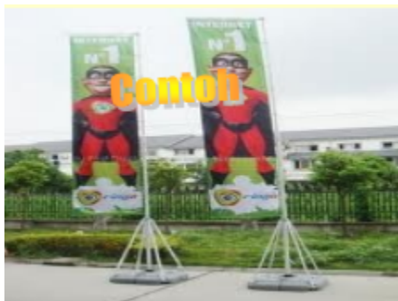
Sebanduk (banting) tempat sendiri