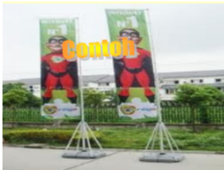
Sepanduk (banting) tempat sendiri