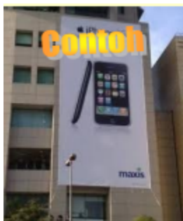
Kain Rentang Besar