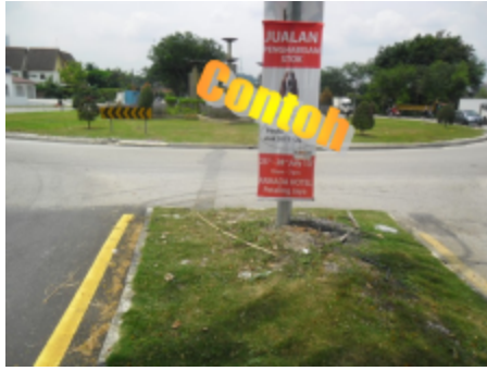
Sepanduk (banting) tempat awam