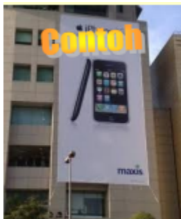
Kain Rentang Besar