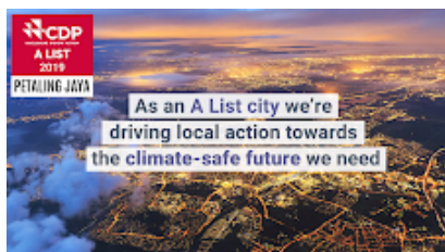
PETALING JAYACities card 3 - English-01.png 9089K