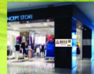
Tiang Pasat Kanan