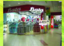
Tiang Pasat Kanan