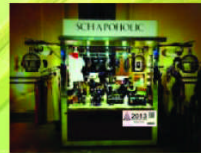
Hadapan Kanan Kios