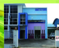
Pagar Masuk Kanan