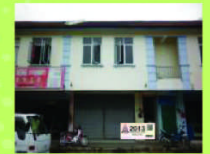
Tiang Pasat Kanan